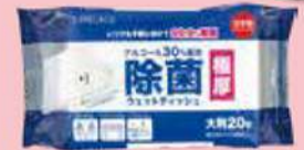
ウェットティッシュ