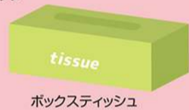
ボックスティッシュ

※お1人さま1回とさせていただきます。※なくなり次第終了します。※写真・イラストはイメージです。