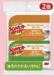
スポンジ2コセット