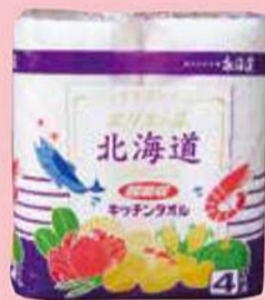
キッチンペーパー