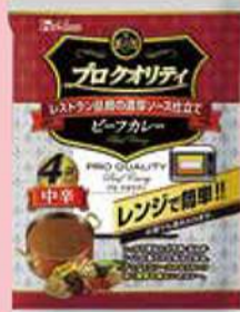
レトロカレー4コセット