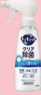
泡スプレー食器洗剤